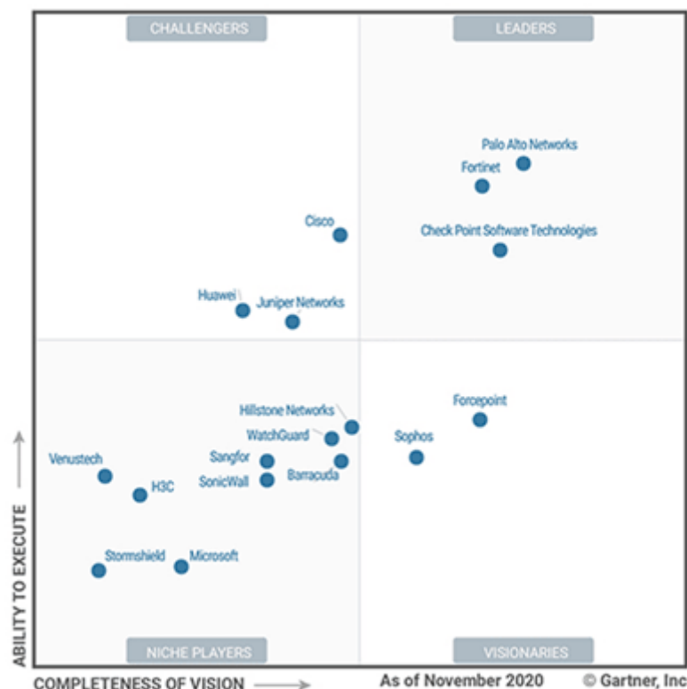
Figure 1. Magic Quadrant for Network Firewalls

Em contrapartida, uma vez que diversos fabricantes podem atender os requisitos técnicos da solução para fins de manutenção da competitividade em um certame aberto, cujo vencedor é aquele que ofertar o menor preço, há possibilidade de o certame resultar em aquisição de solução de fabricante que atenderá às especificações técnicas exigíveis e que está em posição inferior à atual posição do fabricante da solução de firewall contratada pela FUNDACENTRO no quadrante mágico do Gartner mais recente (novembro de 2020) para “Network Firewalls” – apresentado na Figura 2.